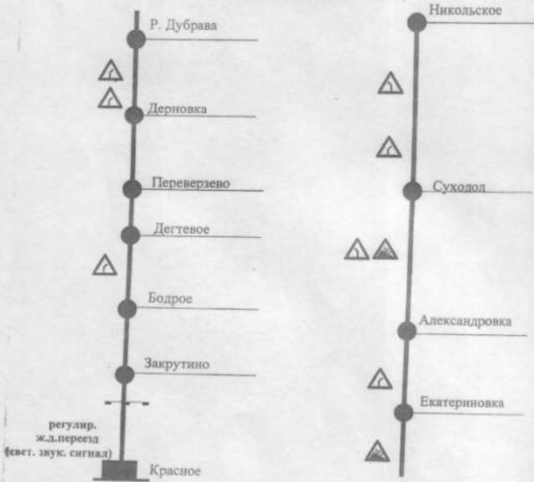
СХЕМА МАРШРУТА С УКАЗАНИЕМ ЛИНЕЙНЫХ И ДОРОЖНЫХ СООРУЖЕНИЙ